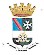
Comune di Amalfi

(art.37, comma 4, del D.Lgs. 50/2016 e ss.mm.ii.)