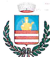
Comune di Minori