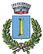
Comune di Furore