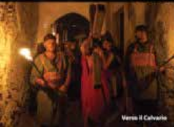
Verità il Calvario